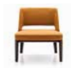
5 OWENS "ARMCHAIR" FAUTEUIL CM 72X72 H76